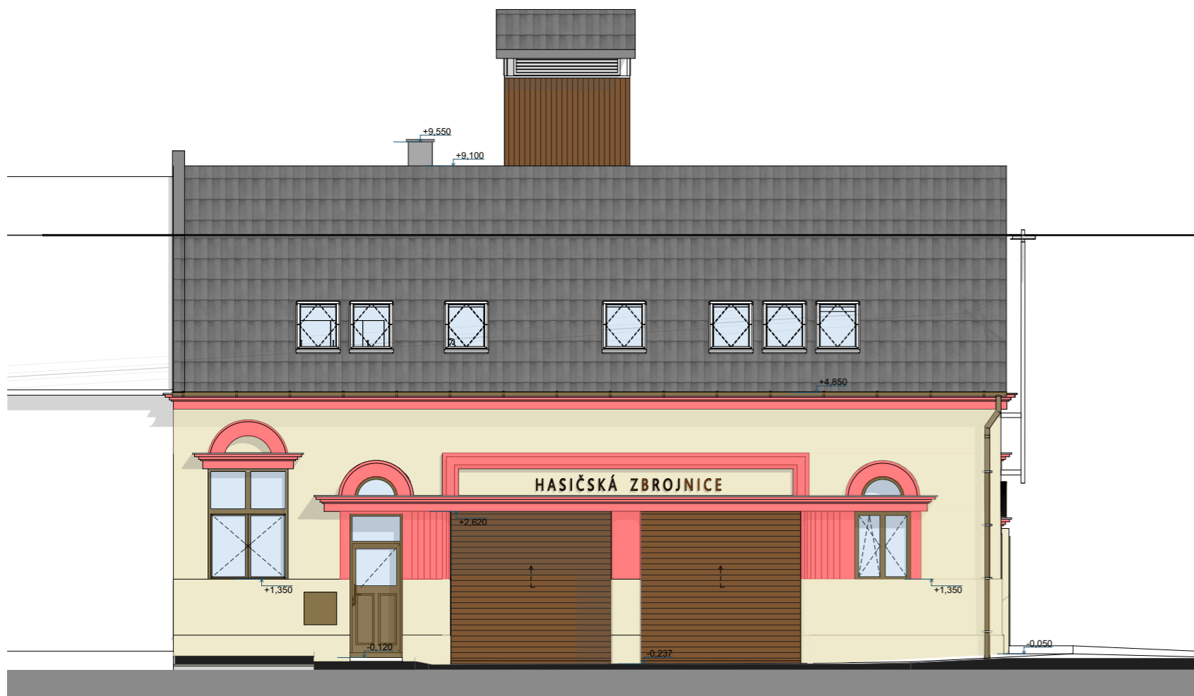
POHLED VÝCHODNÍ (ULICE)